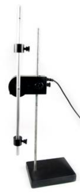
(i) Bewegung eines physikalischen Pendels

Versuche mit dem Drehbewegungssensor (Teil 2)