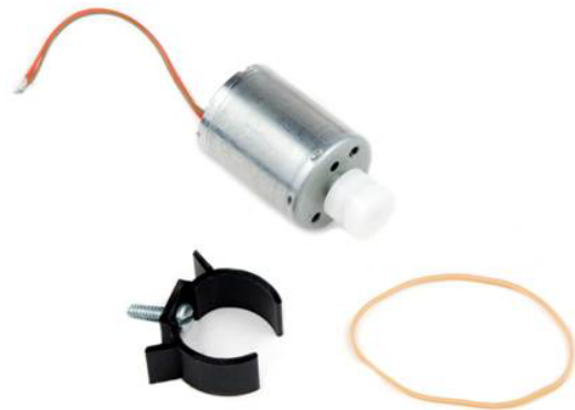
Motorsatz Zentripetalkraft (MK-RMV)