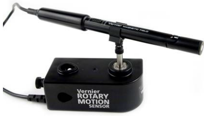
(a) Sensor mit Clip