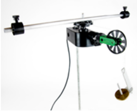
(g) Trägheitsmoment einer Punktmasse

Dieser Versuch benötigt den Zubehörsatz Zentripetalkraft (in untenstehender Zubehörliste aufgeführt). Montieren Sie die Scheibe an der dreistufigen Riemenscheibe und diese sowie die Umlenkrolle am Drehbewegungssensor. Befestigen Sie eine Schnur an der Unterseite der Nabe der Welle. Verbinden Sie die Umlenkrolle über die Drehgelenkbefestigung mit dem Drehbewegungssensor. Führen Sie die Schnur über die Umlenkrolle und bringen Sie ein leichtes Gewicht am Ende der Schnur an. Nutzen Sie das Gewicht um einen Zug auf das System auszuüben, während der Drehbewegungssensor die Winkelbeschleunigung misst. Vgl. Abbildung (f)