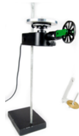
(f) Trägheitsmoment einer Scheibe