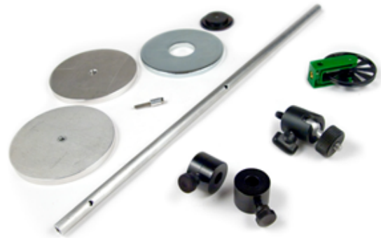
Zubehörsatz Zentripetalkraft (AK-RMV)

Weitere Details unter www.vernier.com/mk-rmv